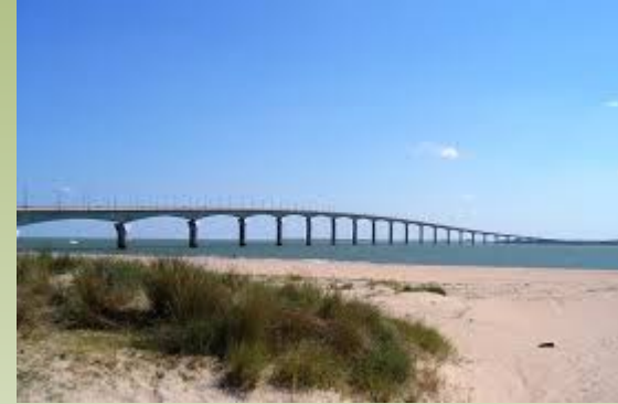
Île de Ré

Wer nimmt teil? → ca. 30 Schülerinnen und Schüler der 8.-9. Klasse