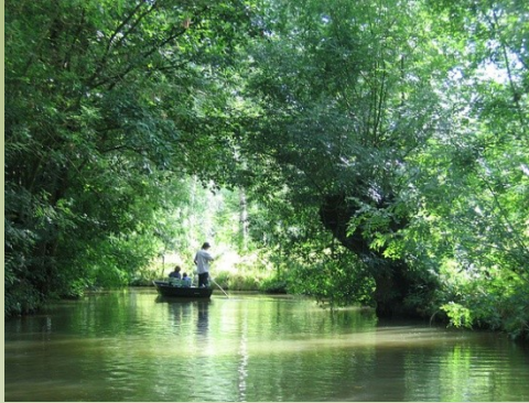
Bootsschatzsuche in den Sümpfen des « Marais Poitevin »