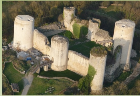
Château de Coudray- Salbart