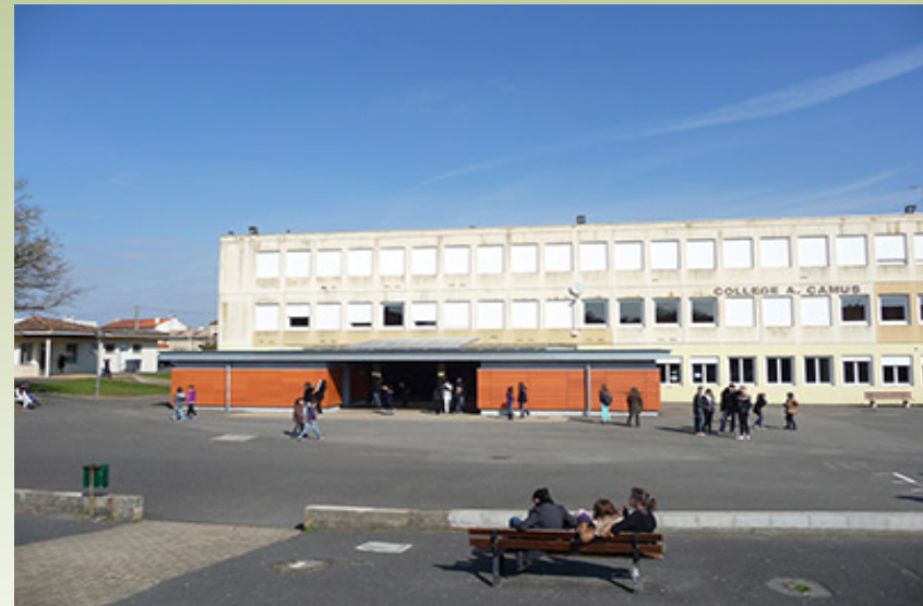
Collège Albert Camus in Frontenay Rohan Rohan