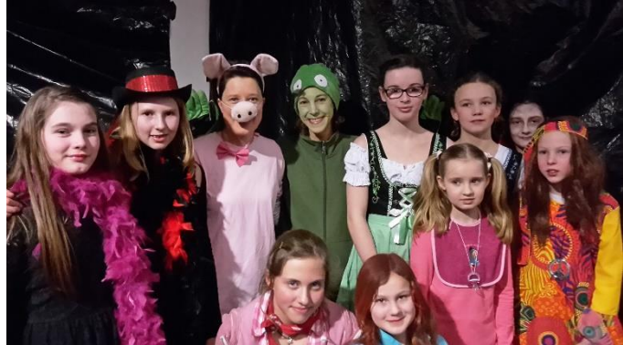
Karnevalsparty der SV 2021

Besondere Lernerfolge und soziale Engagements werden über das digitale Schwarze Brett, die Homepage, Facebook oder in der Zeitung veröffentlicht.