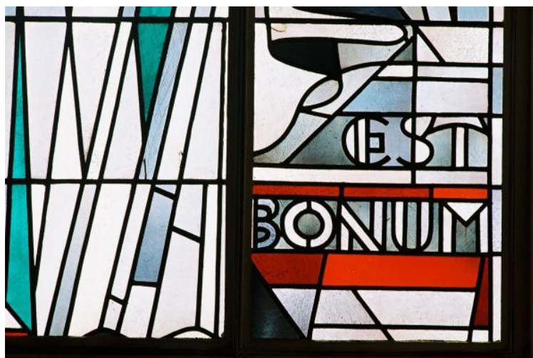
Ausschnitt aus dem Aulafenster (Bild: W. Friedrich)

In den Jahrgangsstufen 8 und 9 werden bilinguale (englisch/ deutsch) Module in je einem der genannten Sachfächer für ein Schulhalbjahr angeboten. Damit die Schüler den höheren Anforderungen besser entsprechen können und um aufgrund der Verwendung der Fremdsprache die fachlichen Inhalte angemessen zu vermitteln, werden dem bilingualen Unterricht in diesen Halbjahren jeweils drei statt der üblichen zwei Wochenstunden eingeräumt.