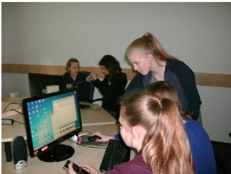
Ausbildung der Medienscouts

Für die gesamte Sekundarstufe I schreibt ein verbindliches Methoden- und Mediacurriculum vor, welche Methoden in welchem Fach eingeführt oder vertieft werden, so dass alle anderen Fächer auf diese gesichert zugreifen können. Dies entlastet den Unterricht, da so Dopplungen vermieden werden! Die Lernkompetenz wird beständig durch Selbstdiagnosen, Evaluation oder auch Vorbereitung auf Aufgabentypen der Arbeiten vertieft.