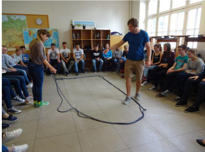
Seminar zum Umgang mit Ausgrenzung und Rassismus

In der Erprobungsstufe werden hierzu die Grundlagen gelegt. Gesonderte Module (z. B. „ Wie packe ich meine Tasche? “, „ Wie bereite ich mich auf eine Arbeit vor? “, „ Wie lerne ich Vokabeln? “ usf.) stehen schon in der Stufe 5 in den Kernfächern an. Verstärkt wird dies im Bereich der modernen Medien durch den vielfältigen Einsatz derselben in Verbindung mit dem „Computerführerschein“ und verschiedenen Projekttagen.