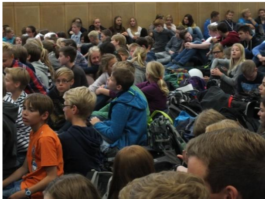
Tag der Ehrungen 2018

soziale Klima und die Wertschätzung innerhalb der Schulgemeinschaft. Durch spezifische Projekte und Aktionen werden die Wertschätzung und das soziale Klima am Dionysianum gefördert.