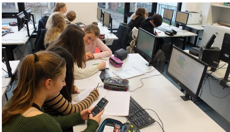
Mathe am PC: In unseren PC-Räumen lernen Schülerinnen und Schüler grundlegende Kompetenzen zur Benutzung digitaler Werkzeuge, z.B. im Mathematikunterricht (2018)

Alle Schülerinnen und Schüler und Schüler unserer Schule werden zu einem kritischen Umgang mit dem PC und dem Internet angeleitet und bei der Ausbildung von Medienkompetenz unterstützt. In der Erprobungsstufe (5./6. Klasse) werden die Grundlagen der Arbeit mit Computern und digitalen Medien im Rahmen eines Medienführerscheins (Stufe 5) und des Faches Informatik (Stufe 6) erlernt. In der Jahrgangsstufe 7 wird die Arbeit mit digitalen Werkzeugen wie beispielsweise Tabellenkalkulation und dynamische Geometriesoftware mit einer Zusatzstunde