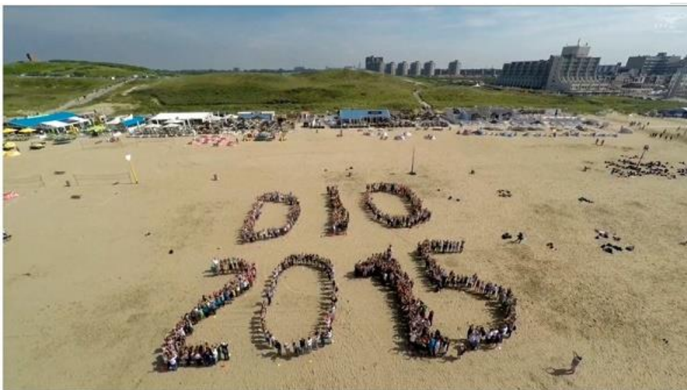
Gemeinsamer Wandertag nach Scheveningen 2015

Um das Potential von Elternmitwirkung im MINT-Bereich zu nutzen sowie Wissen und Erfahrungen aus diesen Berufsfeldern weiterzugeben, werden Elternvertreter ernannt, die sich konkret um die Vernetzung von Schule und Eltern in MINT-Berufen kümmern.