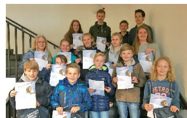
Preisträger des Informatik-Biber Wettbewerbs 2021

Wir bieten im MINT-Bereich regelmäßig Zusatzangebote für unsere Schülerinnen und Schüler und Schüler an. Arbeitsgemeinschaften wie beispielsweise die Robotik-AG oder die Konstruktion eines Stratosphärenballons sollen interessierte Schülerinnen und Schüler und Schüler fordern. Zusätzlich fördern wir die flächendeckende, regelmäßige Teilnahme an